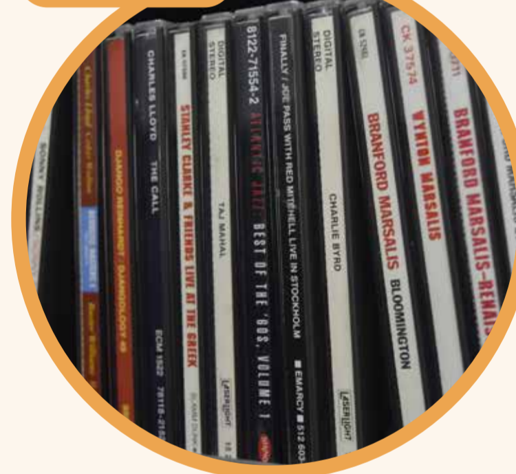
Fonoteca - UN radio > Foto: Julian Ortega, Vicerrectoría de Investigación