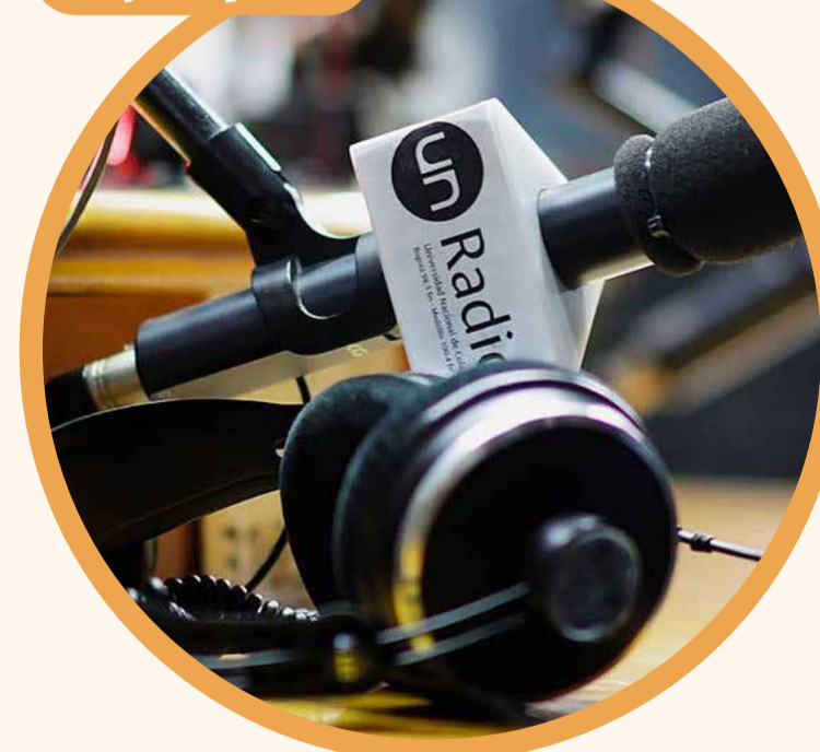
Emisora UN Radio > Imagen tomada de: http://agenciadenoticias.unal.edu.co/detalle/articulo/en-senana-santa-disfrute-y-aprenda-con-un-radio.html