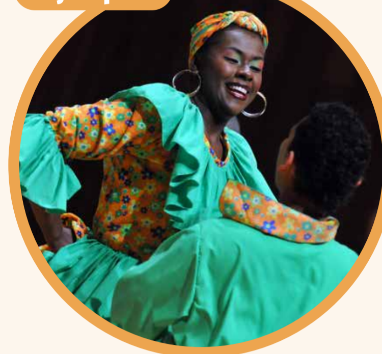
Grupo de Danza folclórica UNAL